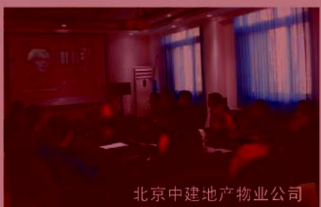
北京中建地产物业公司