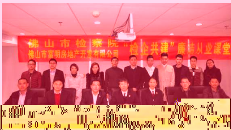
佛山市检察院“检企共建”廉洁从业课堂